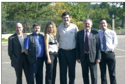
• Quelques exposants arrivés légèrement en retard pour la photo de famille du Mondial 2005 : l'équipe SOMETHY ainsi que le représentant du stand LABORATOIRES NJK MEDICAFARM.