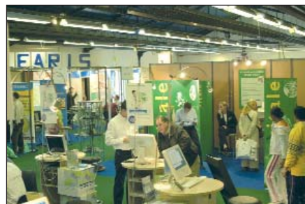
• Village Informatique