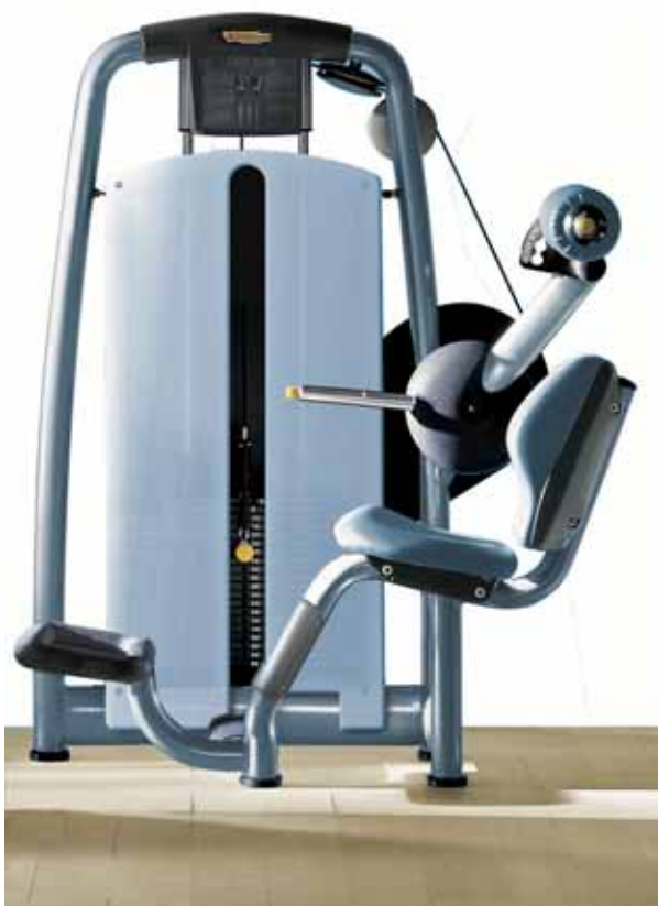
■ Personal Selection version Beauty créé spécialement pour les femmes