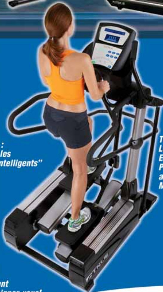
TS1 Strider : Le plus petit Elliptical Professionnel au monde ! Moins 1,3m2 au sol

RUNNER'S WORLD* a désigné TRUE comme la MEILLEURE MARQUE RAPPORT QUALITÉ/PRIX