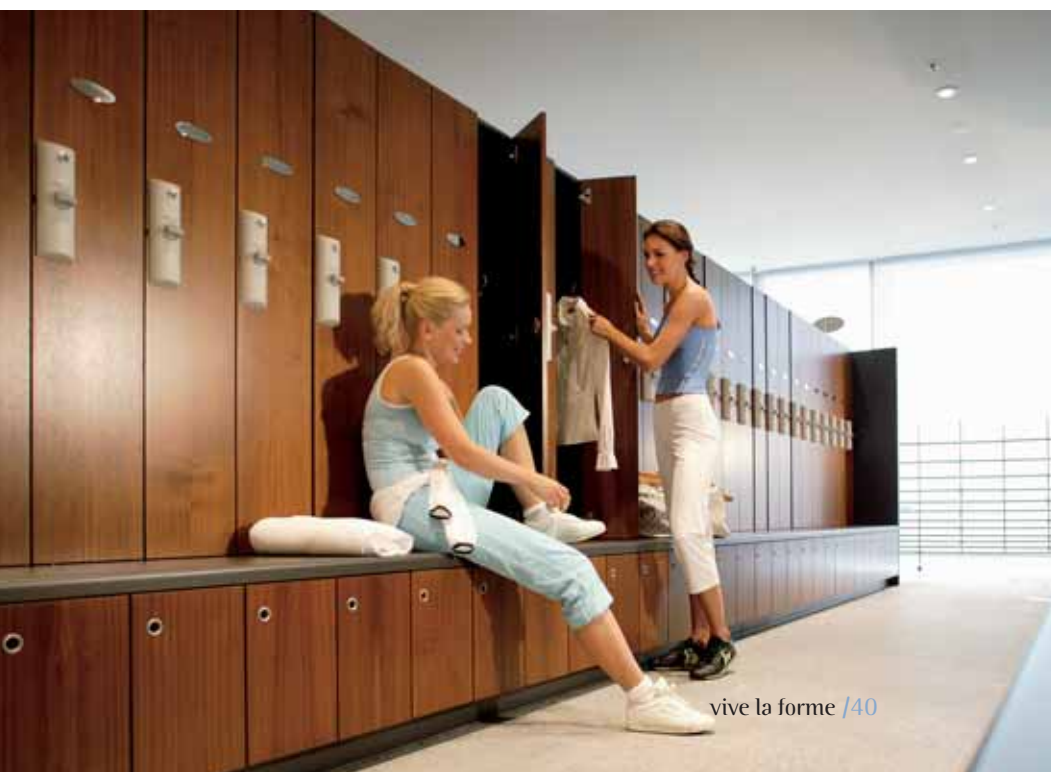
■ Le public exclusivement féminin est un nouveau créneau pour le marché du Fitness & wellness

Le personnel technique de salle doit être également sélectionné et formé avec soin. Le personal trainer doit pouvoir élaborer des circuits d'entraînement spécifiques pour les femmes, comprendre leurs besoins et créer un programme qui leur apporte des réponses adaptées. Un médecin diétologue donnant des conseils nutritionnels sera très apprécié ■