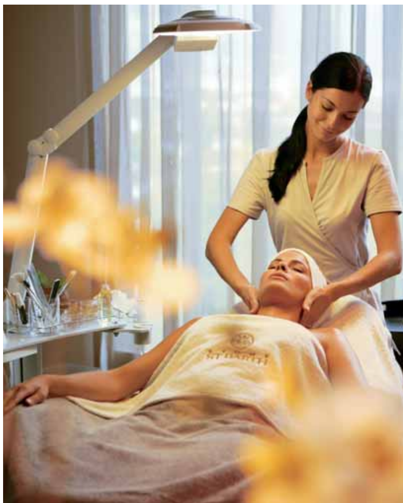
■ Un espace Beauty & Spa proposant les principaux soins de bien-être et de beauté est indispensable dans les clubs pour femmes

Les centres health & fitness réservés aux femmes, une clientèle particulièrement exigeante, sont de plus en plus nombreux