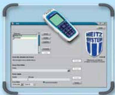
MODULE SMS POUR V11