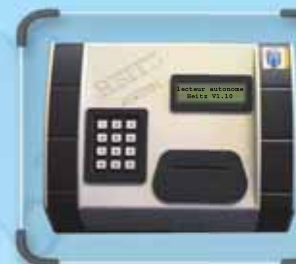
LECTEUR AUTONOME DÉCOMPTE DE POINTS/TEMP POUR U.V.A., SQUASH, SAUN PLAQUE DE GYM VIBRANTE, E