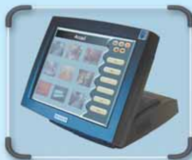
BORNE GYM LIBRE SERVICE - CAISSE TACTILE