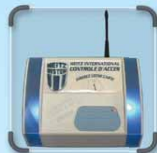
LECTEUR SANS FIL LIAISON RADIO AVEC L'ORDINATEUR ACCES LIBRE SERVICE