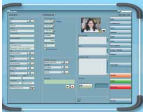
GAMME DE LOGICIELS V11 "LA RÉFÉRENCE"

GESTION - PLANNING - CONTRÔLE D'ACCÈS ÉLÈVEMENT BANCAIRE - POINTS FIDÉLITÉ ETC.