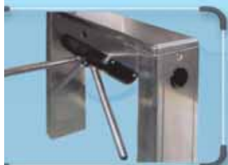
TRIPODE / FMI