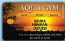
CARTE A PUCE